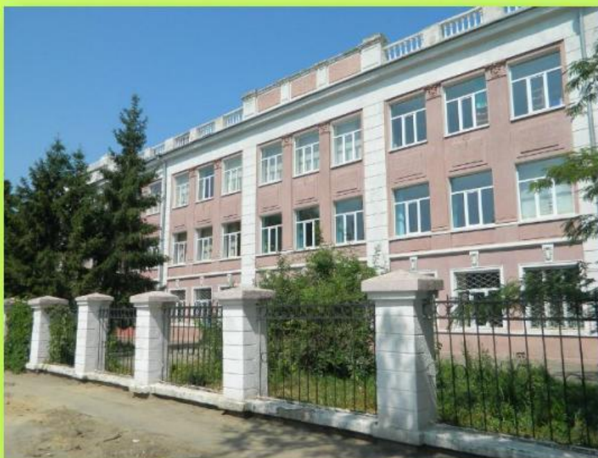
ОДЕССА, ШКОЛА №74