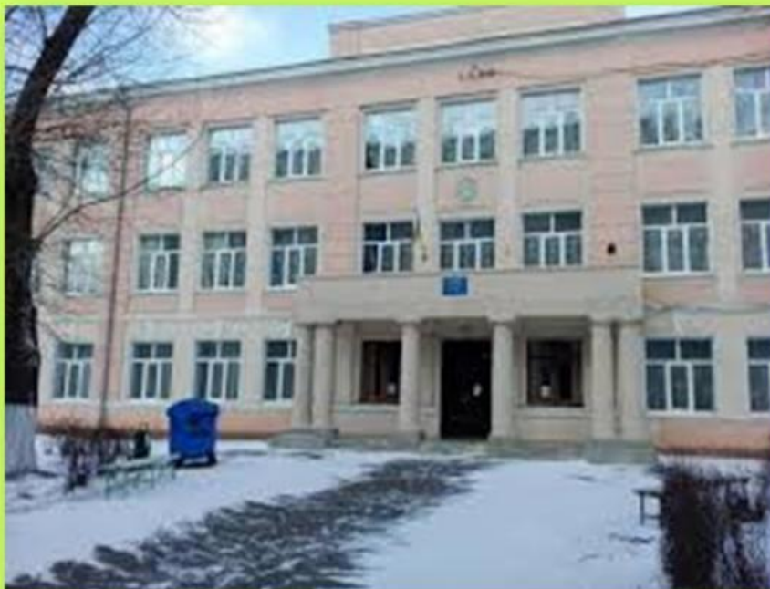
ОДЕССА, ШКОЛА №79 Ул. Водопроводная, 13