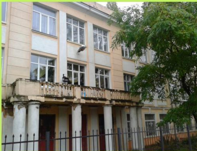
ОДЕССА, ШКОЛА №76 Ул. Воробьева, 24