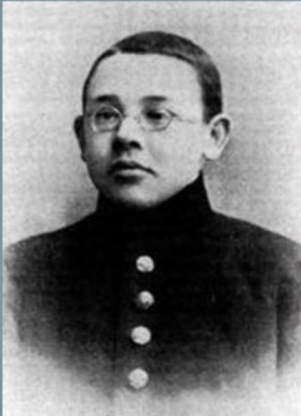
Исаак Бабель в 14 лет в гимназической форме