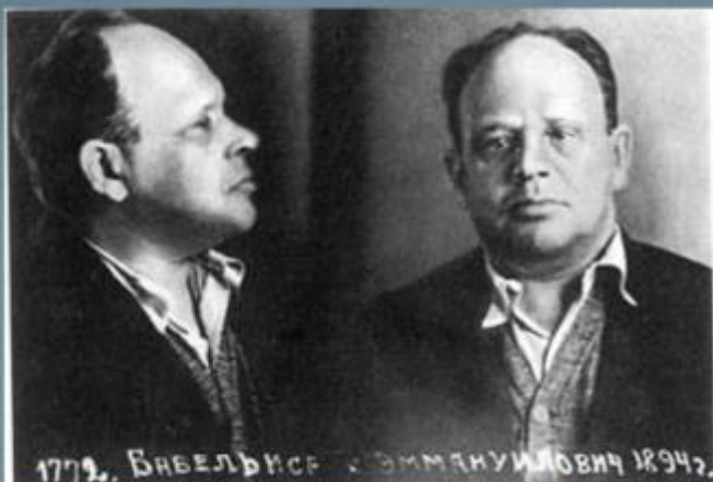
1779. Бабель Исаакович 1894г.