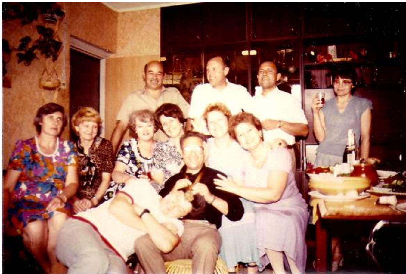
Сегодня приятно вспомнить тогдашнюю юбилейную пьянку у Козла дома!